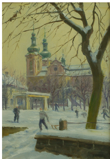
Kostel ve Zlonicích olej karton 17,5 x 24,5

Obrazy V. Tomanova inspirovaly p. Zd. Kopeckého k fotografování stejných motivů. Máme možnost porovnat!