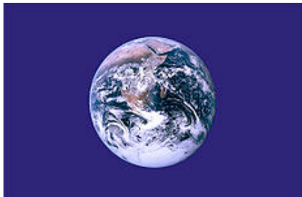
Vlajka Dne Země

Protože 22. duben připadá na neděli, začneme letošní sběr papíru, malých i velkých elektrospotřebičů, tonerů a baterek již ve čtvrtek 19. dubna v 6 hodin ráno. Zástupci