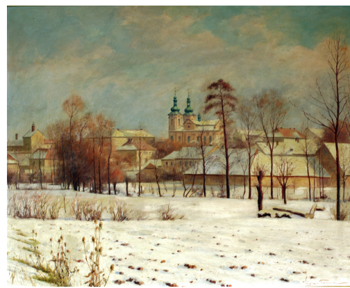
Zlonice od potoka v zimě