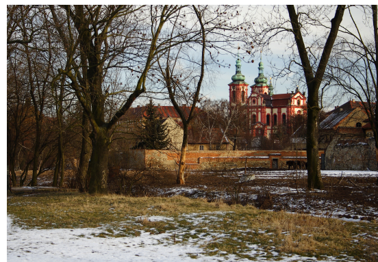
64 x 80