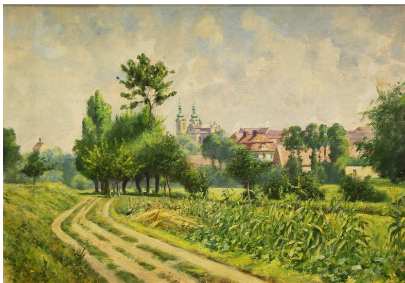
Zlonice od višňovky

A něco hezkého nakonec: na vernisáži jsem zaslechla od jednoho návštěvníka, že existují další Tomanovy obrazy. Takže nic nekončí. Pokud se najde nějaký další nadšenec a bude pátrat dále, je možno využít 120. výročí narození Václava Tomana a uspořádat pokračování v roce 2016. Je to sice až za čtyři roky, ale čas běží velmi rychle. Ještě jednou díky všem.